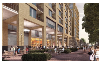
Turnkeykoopovereenkomst voor de verwerving van 36 zorgappartementen in nieuwbouwproject Schalkstad in Haarlem getekend.