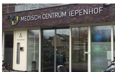
Verwerving Medisch Centrum Iepenhof in Woerden.