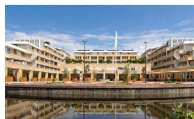
Voorwaardelijke koopovereenkomst voor de verwerving van een bestaand woonzorgcomplex SassemBourg in Sassenheim.