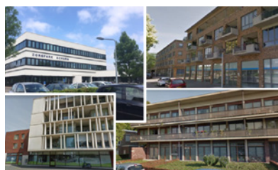
Verwerving van vier gezondheidscentra van ZIO (Zorg in Ontwikkeling) in Maastricht.