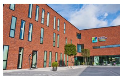
Verwerving van Centrum Oosterwal in Alkmaar.